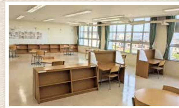
フリースペースはどなたでも 利用することができます